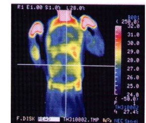
mit TRANCO ® BALANCE